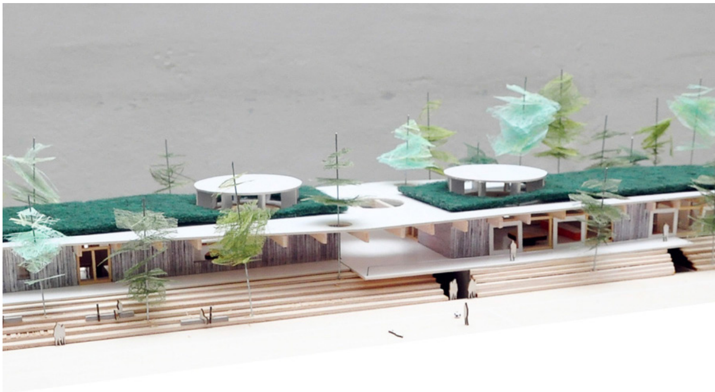
Maquette van het sportgebouw tijdens de wedstrijdphase (BUUR, HOSPER, BULK en ARA)

De ontwerpers en de stad verfijnen nu de plannen in samenspraak met de bewoners en de verenigingen. De uitvoering van het park zou in 2016 van start kunnen gaan.