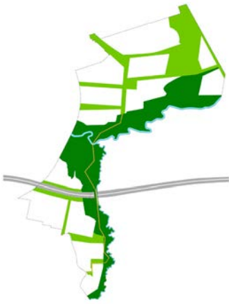
De vallei en de voegen