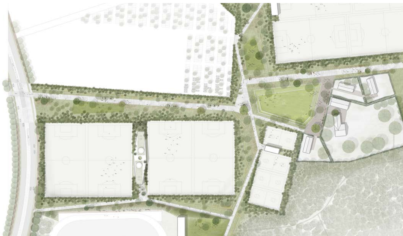
Impressie van voegen en kamers tijdens de wedstrijdphase (BUUR, HOSPER, BULK en ARA)