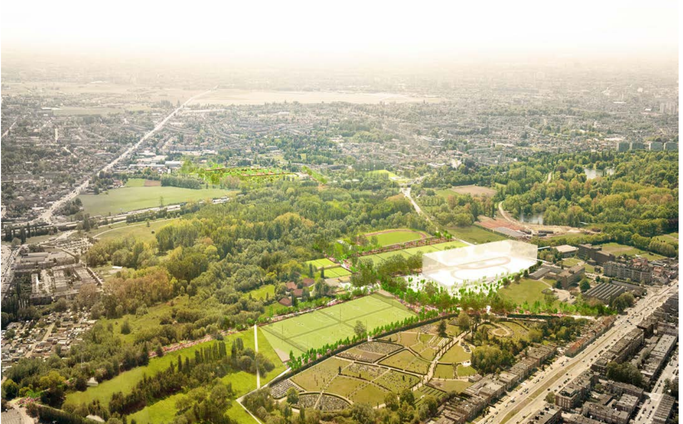
Het park strekt zicht uit als een groene long in de 20ste-eeuwse gordel van Antwerpen (uit het masterplan, Maxwan architects)

groene vinger te versterken. Daarnaast vult een netwerk van noord-zuid georiënteerde lijnen –een reeks ribben– het kenmerkende oostwest systeem aan. Het zal de parkgebruikers van aanpalende wijken op aangename wijze tot diep in het landschapspark van Het Schijn brengen.”